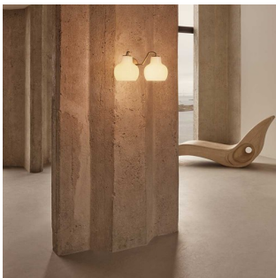
Set location - The Silo

Vilhelm Lauritzen (1894–1984) er en av Danmarks mest betydningsfulle arkitekter noensinne, og han var den banebrytende representanten for den danske funksjonalismen. Flere av bygningene hans, Nørrebro Teater (1931–32), Daells Varehus (1928–35), Radiohuset (1936–41), og den første flyplassen på Kastrup (1937–39), representerte essensen i det moderne livet.